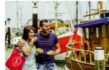
Am Büsumer Hafen spazieren und Fischbrötchen essen.

Zum Nordsseeflair gehört auch ein Hafen. Und neben dem Museumshafen, mit seinen liebevoll restaurierten Kuttern, die die lange Tradition der Berufsschiffahrt auf Büsum dokumentieren, ist in Büsum Fischereihafen heute noch richtig was los. Unter beachtlicher Geräuschkulisse und dem wunderbaren Duft nach Salz und Krabben landen noch heute die bunten Krabbenkutter der Büsumer Flotte an, um ihre Ladung zu löschen. Ein spannender Ort am Tage, um dem Treiben zuzuschauen. Und ebenso wildromantisch bei einem Abendspaziergang.