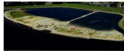
Die „Perlebucht“ bietet tideunabhängigen Badespaß.

in denen übrigens das Nordseewasser regelmäßig aufgefrischt wird – in ein Badebecken und ein Wassersportbecken unterteilt sind, findet Klein und Groß seinen richtigen Platz in der „Perlebucht“.