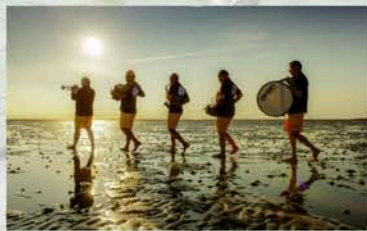
Mit Orchester-Begleitung zur Wattentaufe.

Kosten kommen. Hier ist auch der ideale Ausgangspunkt für eine Wattwanderung in das Weltnaturerbe Wattenmeer. Die Lagune bietet dabei viel Freiraum um in einem der Strandkörbe, in windgeschützten Mulden oder auf den naurbelassenen Gebieten die Seele baumeln zu lassen. Gleichzeitig finden die aktiveren Urlauber eine ganze Reihe von Möglichkeiten, sich nach Herzenslust am und im Wasser auszutoben. Und da die beiden insgesamt 100.000 Quadratmeter großen Innenbecken –